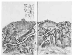
菅江真澄著『月のおろちね』