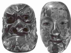
山谷番楽面（個人蔵） 秋田県指定有形民俗文化財