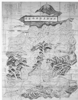
秋田郡黒沢郷御絵図 （秋田市太平黒沢集落）