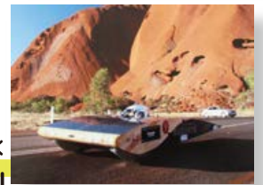
クリーンエネルギーが未来の秋田を拓く ソーラーカー「ジョナサン」