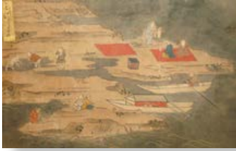
入道崎の水島で飲んで遊ぶ人 男鹿図屏風より