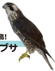
生態系の頂点に君臨する鳥! ハヤブサ