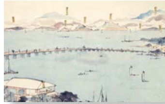
船越から見た八郎潟(明治27年) 蓑虫山人画紀行より