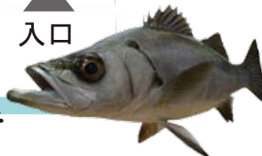
荒磯に潜むモンスター ヒラスズキ