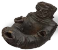
江戸時代に出土した奇妙な土器 人面付環状注口土器