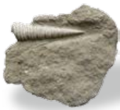
五城目町でも魚や貝の化石採集! サイシュウキリカイダマン