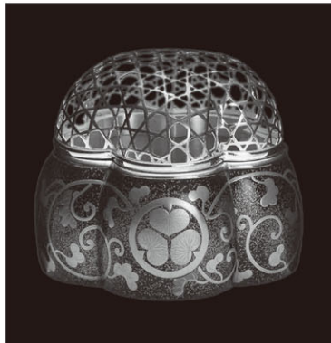
《阿古陀香炉》天璋院所用 徳川記念財団 ※期間限定[10/6(火)～10/25(日)]