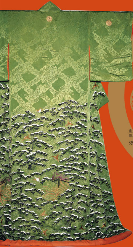
（小袖（萌黄紋縮緬地雪持竹雀文様牡丹紋付）） 天璋院所用 徳川記念財団