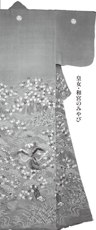
皇女・和宮のみやび

〒010-0124 秋田県秋田市金足崎崎字後山52 Tel.018-873-4121 Fax.018-873-4123 http://www.akihaku.jp/