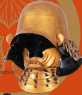
重文（白檀塗真彩兜） 徳川家康所用 久能山東照宮博物館 ※期間限定[10/6(火)～10/25(日)]