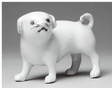
《薩摩 磯御庭焼 錦手狗》天璋院所用 徳川記念財団