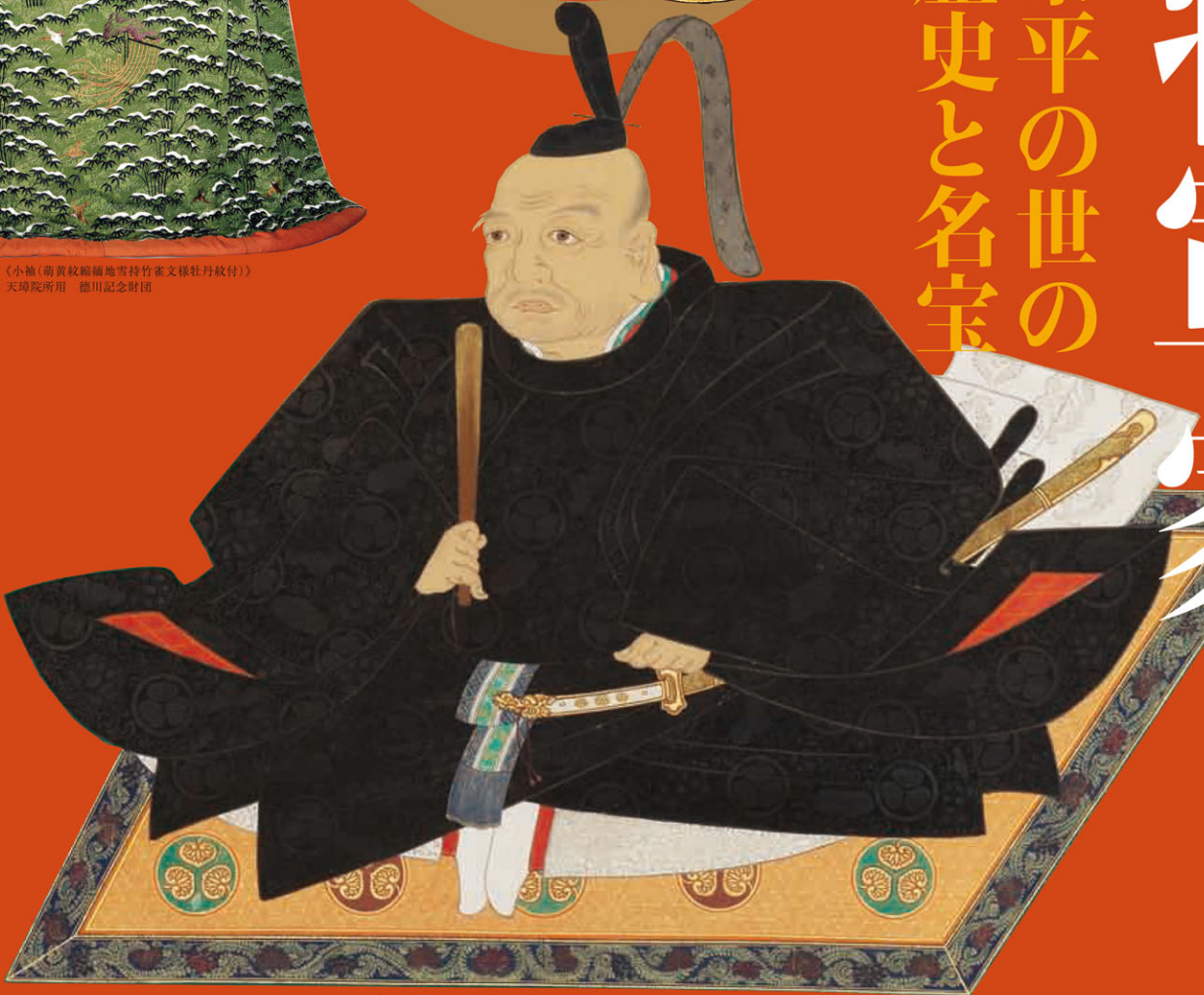
（東照大権現像(畫夢)）(部分) 徳川記念財団