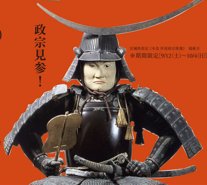
宮城県指定(木造 伊達政宗像) 瑞巖寺 ※期間限定[9/12(土)～10/4(日)]