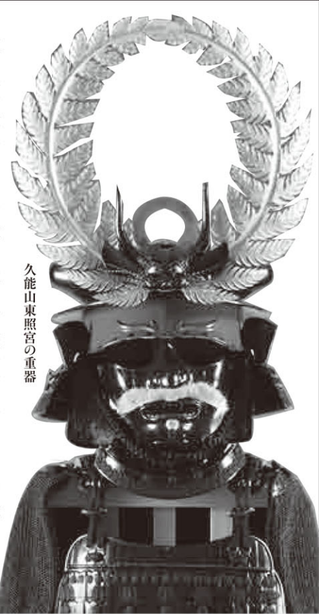
《貫衆具足》 徳川家綱寄進 久能山東照宮博物館