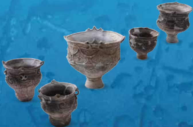
六反田南遺跡 縄文時代中期 公益財団法人新潟県埋蔵文化財調査事業団所蔵 各地の交流を示す豊かな装飾の縄文土器群

中核展示(全国巡回展) 新発見考古速報 旧石器～近代まで全国22遺跡の最新成果を展示