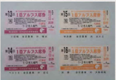
第 100 回全国高等学校野球選手権記念大会入場券