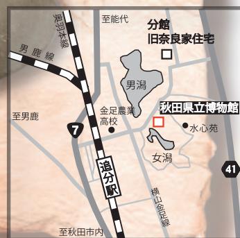
博物館アクセスマップ