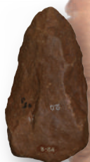
インド・マドラス採集の ハンドアックス

長さ約20cm。礫の周囲を打ち 欠いて左右対称に仕上げられた 人類最初期の「握斧」。 前期旧石器時代。 明治大学博物館蔵