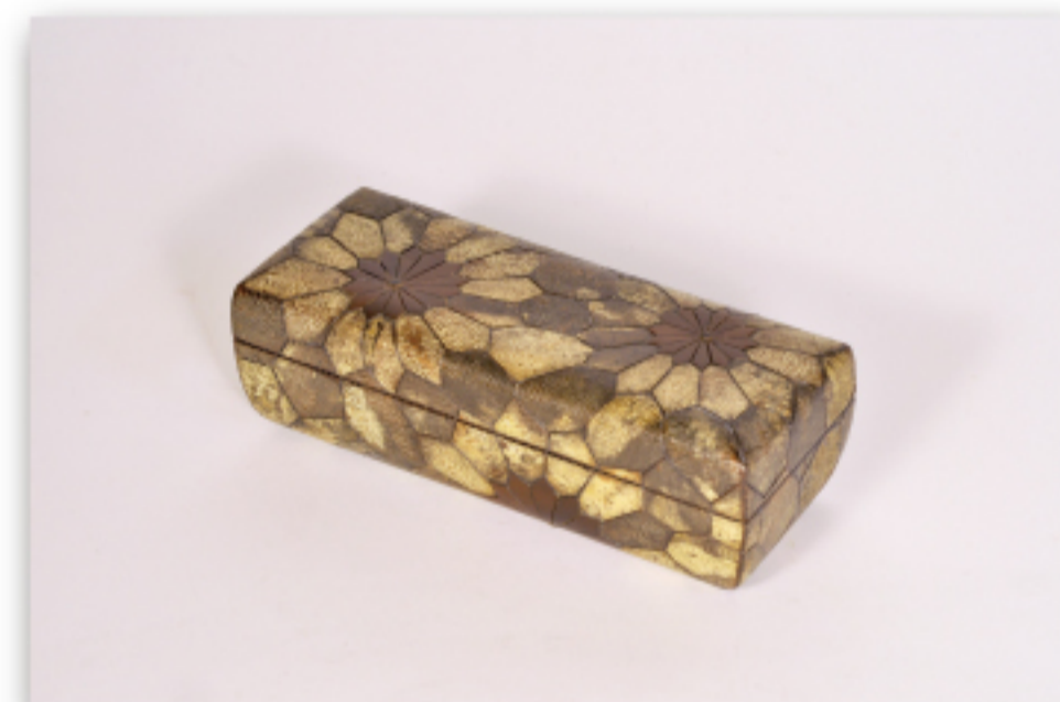
桜皮細工 菊模様宝石箱