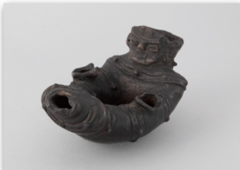
人面付環状注口土器（重要文化財）