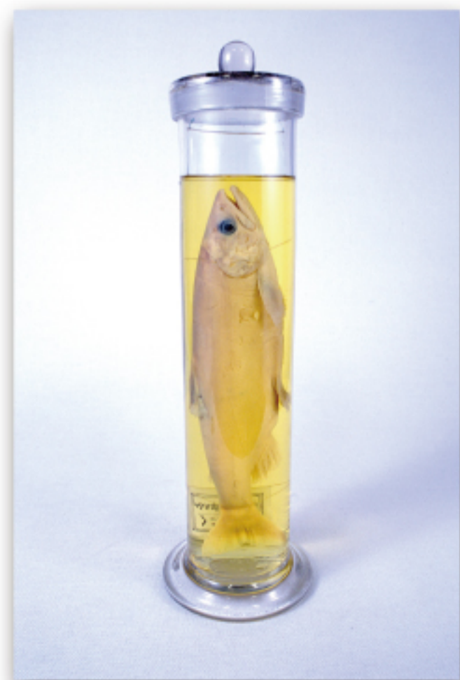
クニマス液浸標本（登録記念物）