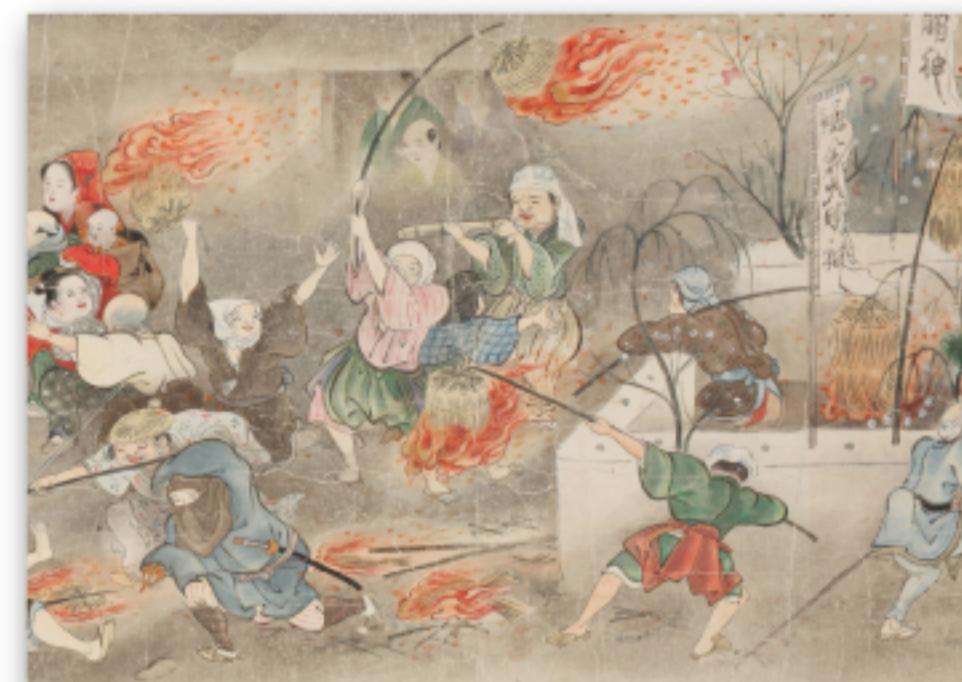
秋田風俗絵巻（秋田県指定有形文化財）

秋田県立博物館 Tel：018-873-4121 Fax：018-873-4123 e-mail：info@akihaku.jp