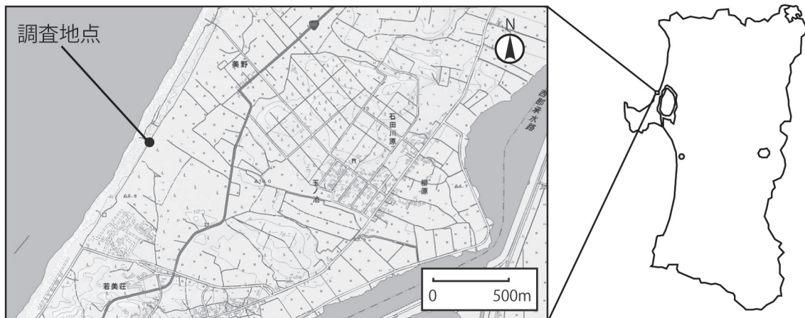
図2. 調査地（国土地理院ホームページ 標準地図（25000）をもとに作図）