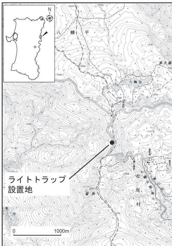
図1. 調査地位置図 (国土地理院発行2万5千分の1地形図「八幡平」 を使用)

調査は高橋と梅津が別々に行い、2005年は6月26日から10月11日の間に計10回、2006年は6月11日から10月14日まで計11回実施した。水