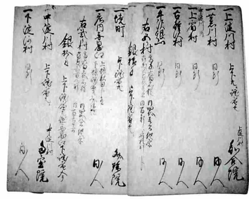
(9才) (8ウ) =書式例=